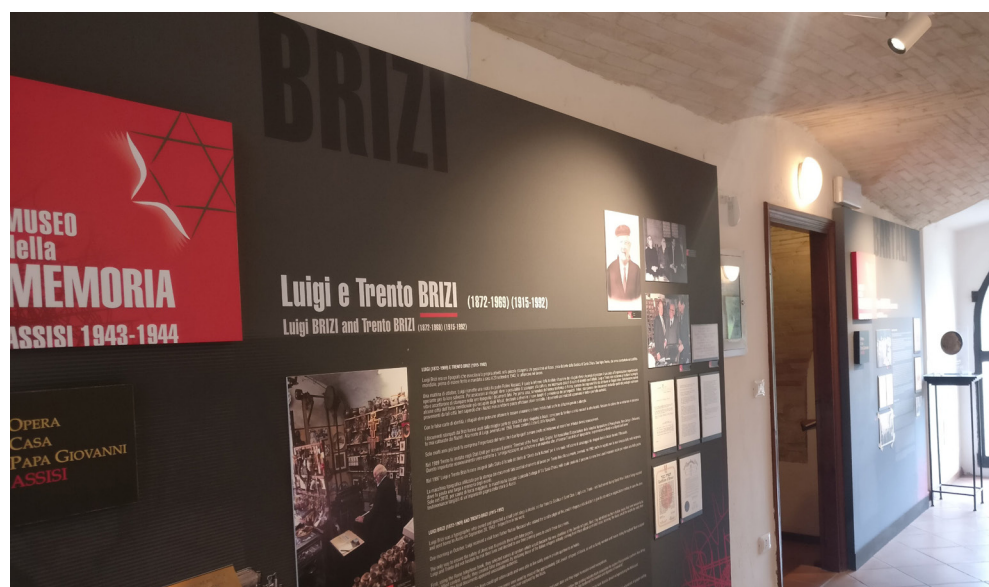
I tipografi Brizi hanno stampato carte d'identità false per salvare gli ebrei

Se da una parte va ricordato l'alto prezzo pagato dal popolo ebreo, sterminato in maniera orribile, dall'altra c'è l'esigenza di sottolineare gesti di solidarietà, fratellanza e pace che tante persone hanno fatto per salvare questo popolo, perseguitato da un'ira disumana e inconcepibile. Una di queste persone è stata Don Aldo Brunacci che, insieme al vescovo di Assisi, monsignor Placido Nicolini si adoperò, in prima persona, rischiando