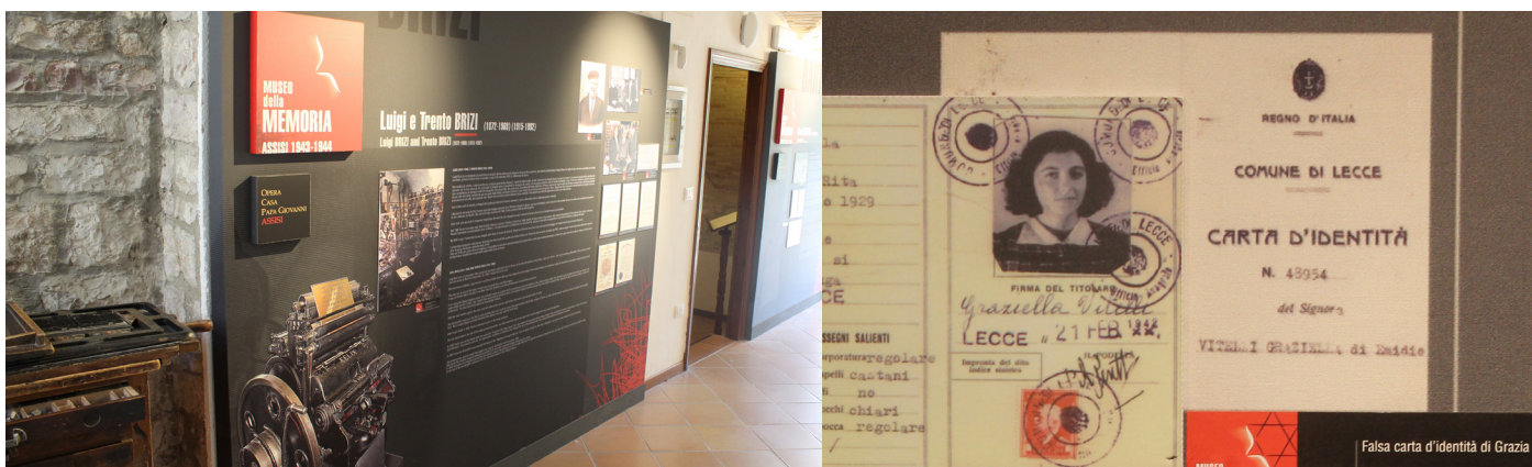
A sinistra: i tipografi Brizi stamparono le carte d'identità false per salvare gli Ebrei. A destra: una delle carte d'identità.