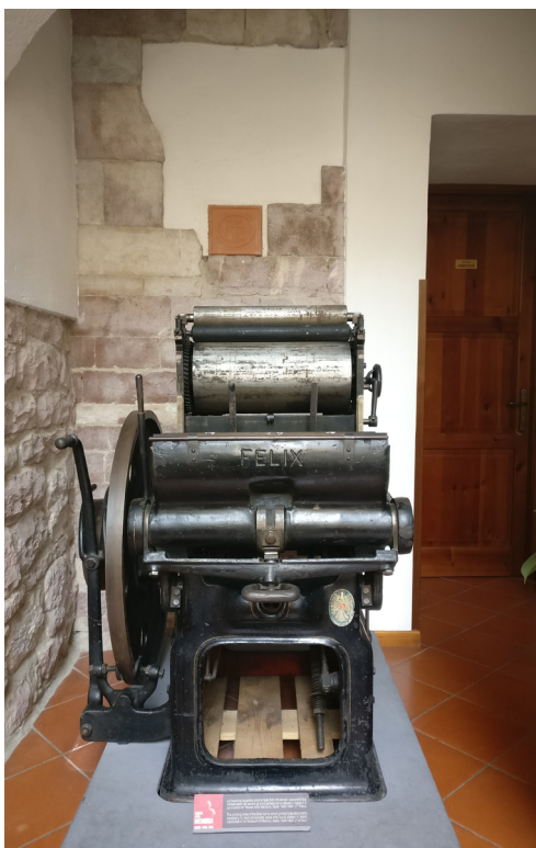
La macchina tipografica che ha stampato i documenti falsi