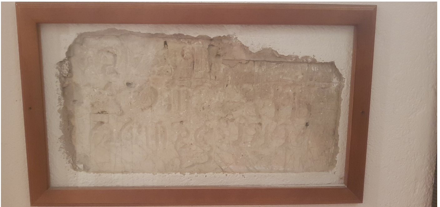
(Scritta in ebraico incisa dagli ebrei nei muro del sotterraneo dell'episcopio in cui erano nascosti)

Successivamente inviare la scheda di adesione allegata (in ultima pagina), compilata in tutte le sue parti, all'indirizzo di posta elettronica assisimuseodellamemoria@gmail.com con almeno 20 giorni di anticipo rispetto alla data prescelta della quale va comunque verificata la disponibilità.